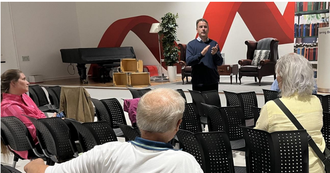
Møde med MF Christian Friis Bach (RV) om drøftelse af hvorledes og hvorvidt klimaaftryk af importerede varer bør indgå i Danmarks og EU's klimapolitik