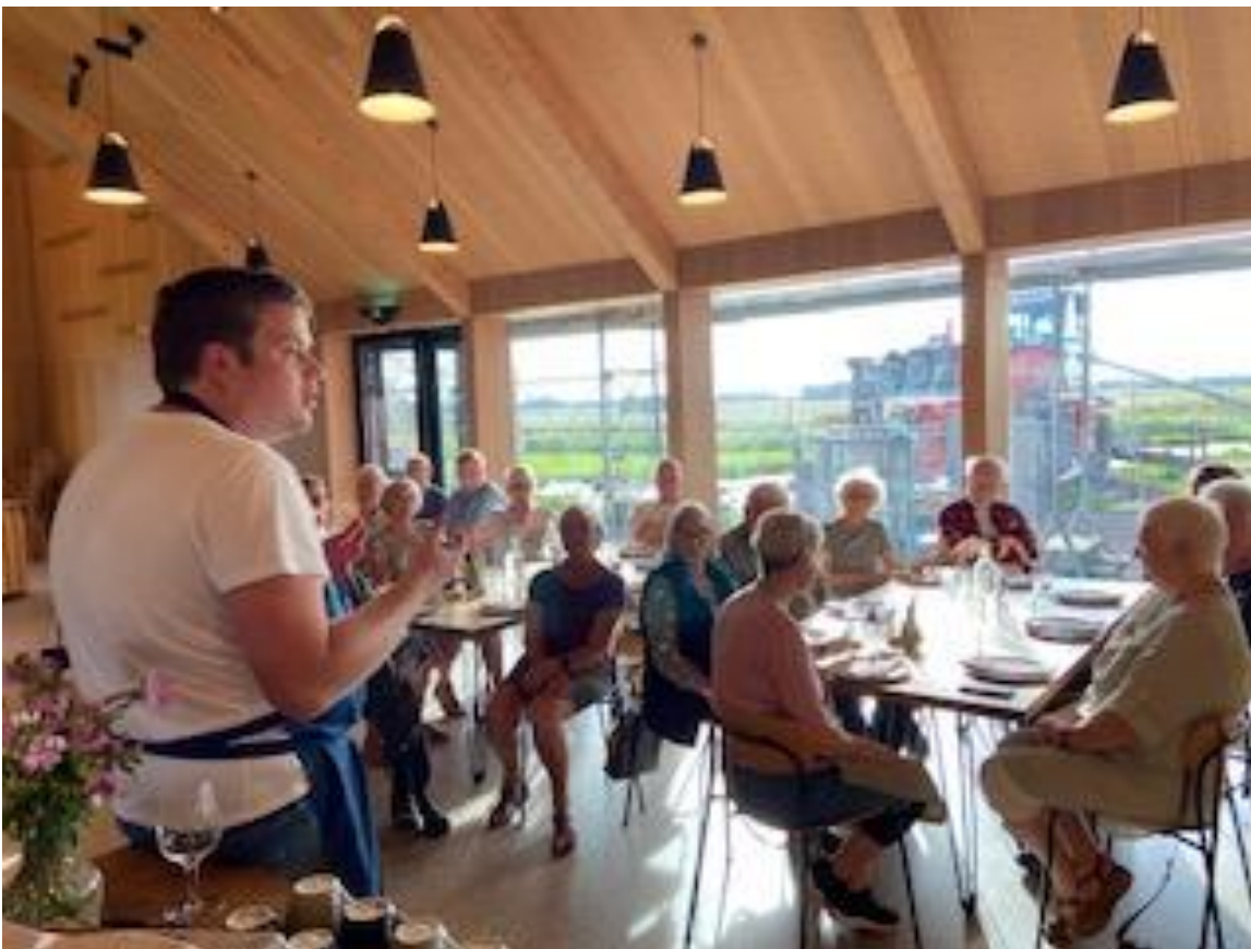
Foredrag og spising på Kornets hus om Korn og bælgfrugter