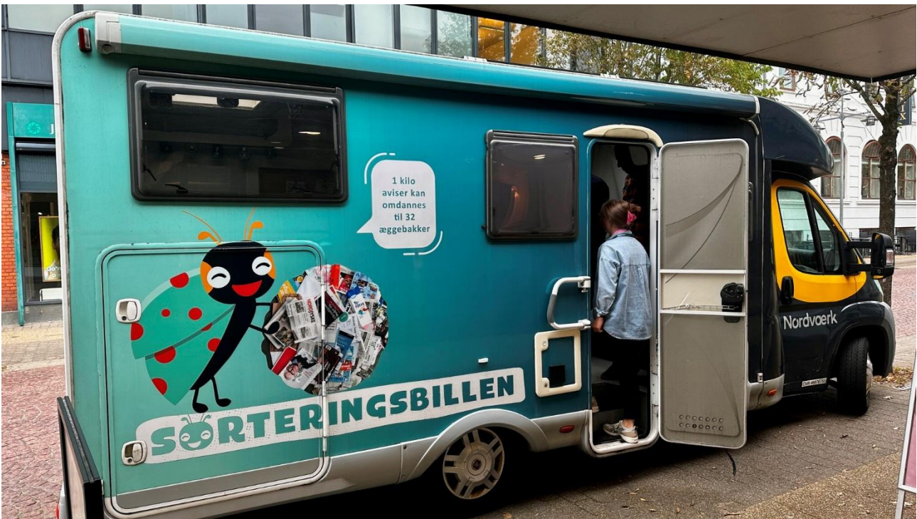
Besøg fra skoleklasse hos Nordværk for at lære om at sortere affald specielt med fokus på de nye regler om tekstilaffald. Der blev også mulighed for selv lave papir af gamle aviser