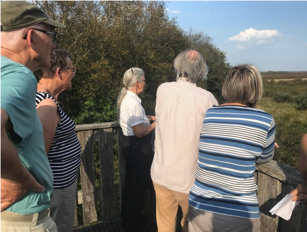
Tur i Vildmosen hvor der ses på spagnumproduktion, højmoser og græsletter under afvikling