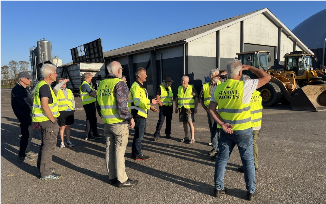
Interessant besøg på Sindal Biogasanlæg og indlæg om Power2X anlæg