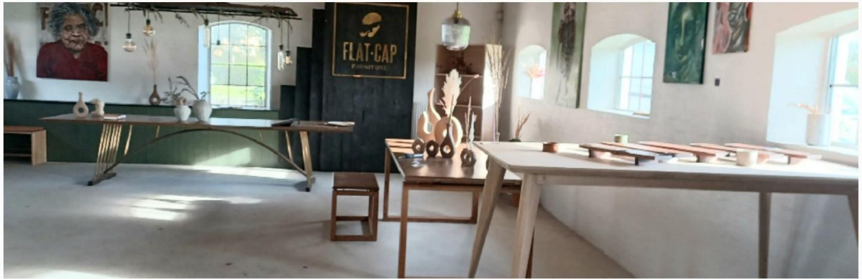
Fra Vendsyssel "små og specielle" hvor Flatcap Furniture lagde plads til de mange aktiviteter