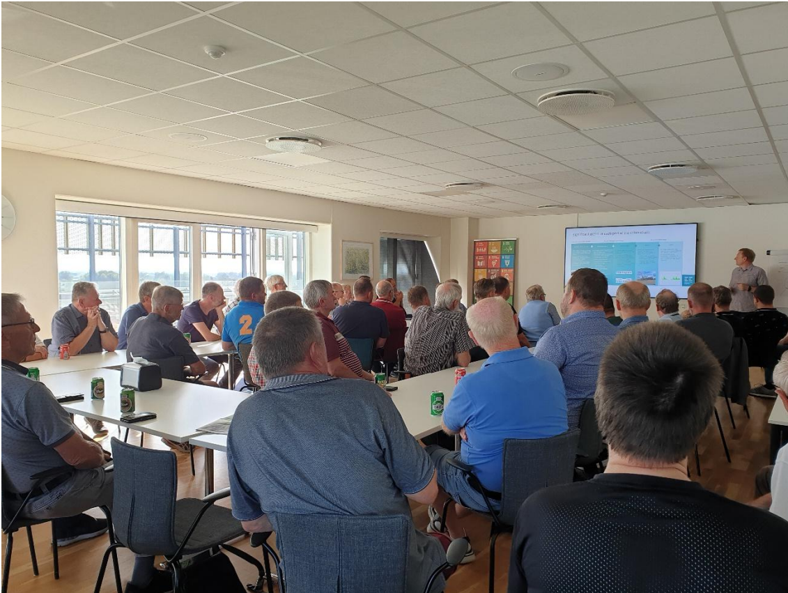
Interesserede tilhørere på Flisværket i Brønderslev for at høre European Energy og Brønderslev Forsyning fremlægger plan om Power2X- anlæg syd for Brønderslev